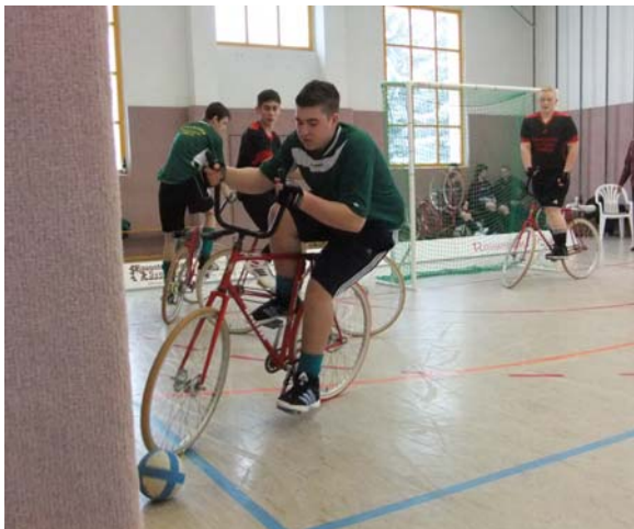
Sangerhausen und Reideburg qualifizierten sich für das Viertelfinale der Deutschen Meisterschaft.

Landesmeister wurde Sangerhausen vor Reideburg und Colbitz.