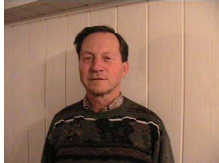
Tollwitz, Februar 2013

Für die übermittelten Glückwünsche, Blumen und dem besonderen ausgewählten Geschenk von unseren Vereinsmitgliedern anlässlich meines 70. Geburtstages. Hoffe die anwesenden Sportfreundinnen und Sportfreunde haben eine schöne gemütliche Geburtstagsfeier in Erinnerung. Ein besonderer Dank nochmals an meinen (unseren) Chef-Unterhalter DJ Jörg.